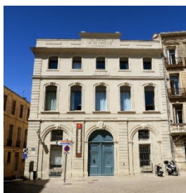
Hôtel Lagarrigue où se déroulent les cours de CPGE