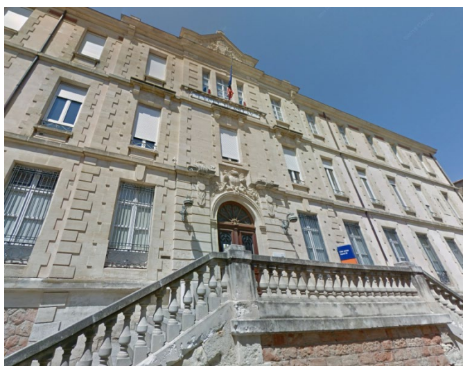
Cité scolaire Henri IV Entrée du bâtiment principal

De toutes les CPGE, la B/L, dite aussi Lettres et Sciences Sociales , offre l'éventail de formation et d'orientation le plus ouvert, des sciences sociales et humaines aux disciplines littéraires et aux mathématiques appliquées. Elle permet d'acquérir un très bon niveau en lettres et sciences humaines, tout en acquérant les connaissances mathématiques nécessaires à la poursuite d'études en sciences économiques et sociales.