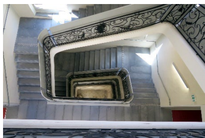
L'escalier central de l'Hôtel Lagarrigue